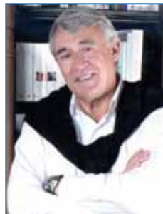
Claude Goasguen Député Maire du 16 e arrdt de Paris

L'ambiance y sera festive au cours de ce mois de mars. Venez vous détendre en pensant à vos prochaines vacances, en chantant, dansant, apprenant, déjeunant, seul(e) ou en famille.