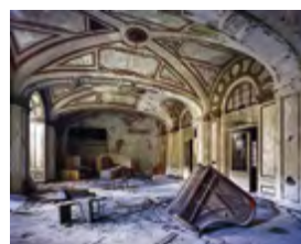
© Yves Marchand et Romain Meffre