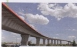
Pont de Cheviré (1986-1991) Pont routier de 1 563 m de long, il relie les rives de la Loire entre Cheviré et Roche-Maurice. Sa hauteur de 52 m permet le passage des navires. Son tablier central, 162 m, a été réalisé d'une seule pièce.