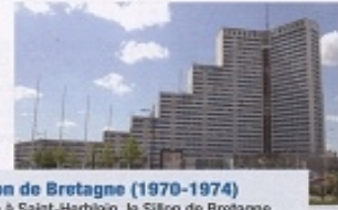
Sillon de Bretagne (1970-1974) Situé à Saint-Herblain, le Sillon de Bretagne est le plus grand immeuble HLM de l'ouest. Il comprend 875 logements sur 28 étages constituant une petite ville de 3 600 personnes sans compter les 13 500 m 2 de bureaux.