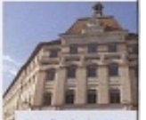
Lycée Guist'hau Il porte le nom d'un ancien maire de la ville. Les bâtiments d'origine ont été rasés et remplacés par de nouveaux au début du XX e siècle. À l'origine lycée de jeunes filles, il devient mixte en 1970. Il se distingue dans le paysage urbain par ses toitures de tuiles.