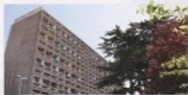
Cité Radieuse de Rezé (1953-1955) Symbole du patrimoine du XX e siècle, la Cité est l'œuvre de l'architecte Le Corbusier. Elle comprend 294 logements pouvant accueillir 1 400 personnes ainsi qu'une école et, à l'origine, un bureau de poste. Elle est classée Monument Historique en 2001.