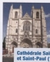
Cathédrale Saint-Pierre et Saint-Paul (1434-1891) Lancée en 1434 par le duc de Bretagne, Jean V, et l'évêque de Nantes, Jean de Malestroit, la construction de l'actuelle cathédrale gothique ne sera achevée qu'en 1891. Elle est classée Monument historique en 1862.