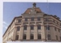
Lycée Guist'hau (1882) Il porte le nom d'un ancien maire de la ville. Les bâtiments d'origine ont été rasés et remplacés par de nouveaux au début du XX e siècle. À l'origine lycée de jeunes filles, il devient mixte en 1970. Il se distingue dans le paysage urbain par ses toitures de tuiles.