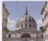
Église Notre-Dame de Bon-Port (1842-1866) Reconnaisable à son dôme, inspiré par celui des Invalides de Paris, elle est l'une des premières églises dotées d'une charpente métallique. L'église n'a jamais été achevée : son dôme devait être flanqué de deux tours de 33 mètres de haut.