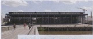
Palais de Justice (2000) Œuvre de l'architecte Jean Nouvel, le Palais de Justice de Nantes suggère la puissance et la force de la justice. La forte présence du métal est une référence au riche passé industriel de l'île de Nantes.