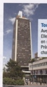
Tour de Bretagne (1971-1976) Avec 32 étages, cette tour s'élève à 144 m. Elle est la 3 e plus haute tour de bureaux en région après Lyon et Marseille. Près de 800 personnes y travaillent chaque jour dans 16 000 m 2 de bureaux.