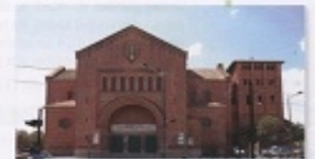
Église Sainte-Thérèse (1935-1963) Sainte-Thérèse est reconnaissable à ses briques rouges et son style romano-byzantin. Interrompue en 1939, la construction ne reprit qu'en 1952, sur les ruines laissées par les bombardements de 1943.