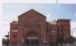
Église Sainte-Thérèse (1935-1963) Sainte-Thérèse est reconnaissable à ses briques rouges et son style romano-byzantin. Interrompue en 1939, la construction ne reprit qu'en 1952, sur les ruines laissées par les bombardements de 1943.