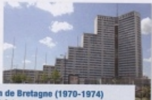
Sillon de Bretagne (1970-1974) Situé à Saint-Herblain, le Sillon de Bretagne est le plus grand immeuble HLM de l'ouest. Il comprend 875 logements sur 28 étages constituant une petite ville de 3 600 personnes sans compter les 13 500 m 2 de bureau.