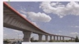
Pont de Cheviré (1986-1991) Pont routier de 1 563 m de long, il relie les rives de la Loire entre Cheviré et Roche-Maurice. Sa hauteur de 52 m permet le passage des navires. Son tablier central, 162 m, a été réalisé d'une seule pièce.