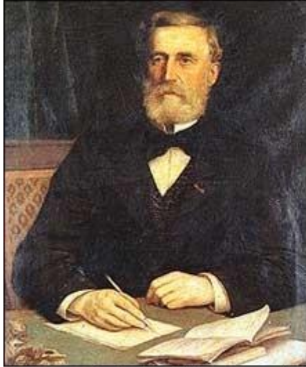
Hersant de la Villemarqué pe Kervarker Barzhaz Breizh

Loperhet le jeudi 2 avril 2015 à 18h30 au foyer St Yves