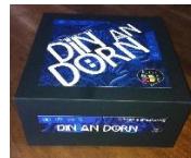
Aozet get / Organisé par Emglev Bro an Oriant

« Din an Dorn » ha « Klask ar Ger », c'hoarioù e brezhoneg.