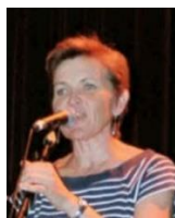
Aozet get / Organisé par Ar un dro e Gwidel