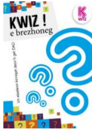
Aozet get / Organisé par Emglev Bro an Oriant ha DAO

Kwiz e brezhoneg (c'hoari goulennoù) da 2 e 30 goude merenn. Un abadenn evit kaout plijadur o c'hoari hag o komz e brezhoneg. Aozet e vo ar c'hoari dre skipailhoù. Digor d'an holl (bugale/tud deuet ; deraoudi/tud barrekoc'h). Digoust