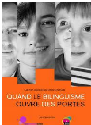
Aozet get / Organisé par Div Yezh Gwidel