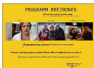
Aozet get / Organisé par Emglev Bro An Oriant