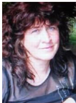
Aozet get / Organisé par Spered Kewenn