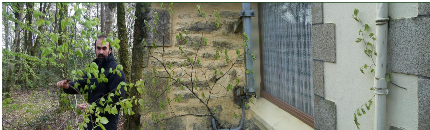
En cueillette (Erwan Madec), branches de mai posées sur deux habitations dans les environs de Baud