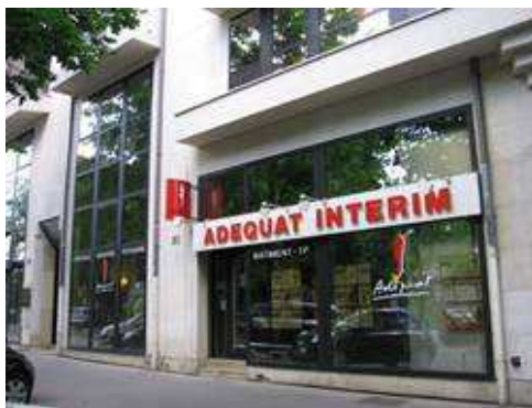
Agence de Dijon

Après l'ouverture d'une première franchise en 2009 à Montigny-le-Bretonneux (78), le réseau a choisi, en raison de la crise, de freiner ses implantations afin de ne pas mettre en danger ses futurs franchisés face à l'incertitude économique. Ayant surmonté cette période avec brio, Adéquat a décidé de relancer le développement en franchise.