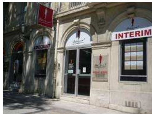
Agence de Montpellier