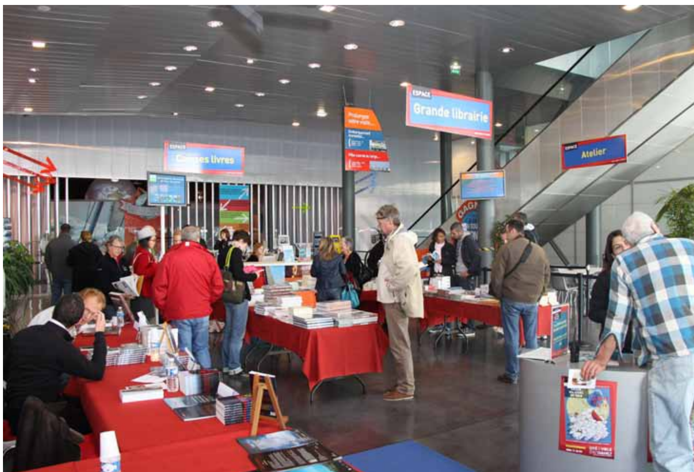
Salon du Livre de Mer à la Cité de la Voile Eric Tabarly