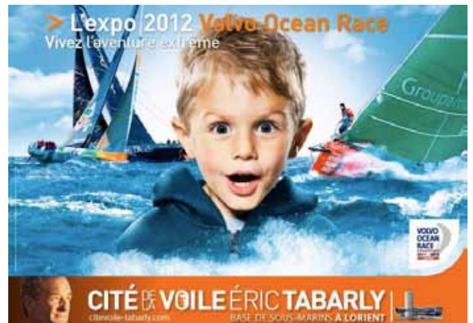
Exposition à la Cité de la Voile Eric Tabarly

Grâce à un dispositif audiovisuel exceptionnel, les visiteurs entrent dans l'univers de la Volvo Ocean Race.