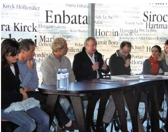
Cafés littéraires au Salon du Livre de Mer, copyright Sellor