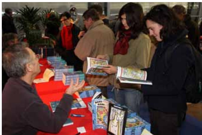
Rencontre avec les auteurs