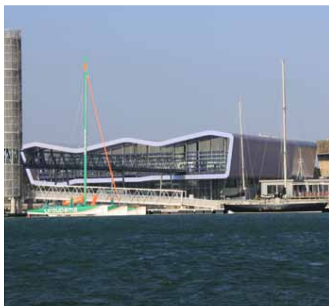
La Cité de la Voile Eric Tabarly à Lorient, copyright Sellor

- par avion (aéroport de Lorient Bretagne Lann-Bihoué) avec 4 liaisons quotidiennes sur Paris-Orly, 3 liaisons quotidiennes sur Lyon, 2 liaisons hebdomadaires sur Galway, Waterford et Cork (en saison) - GPS 47° 43'50'' N - 3° 22'25'' O