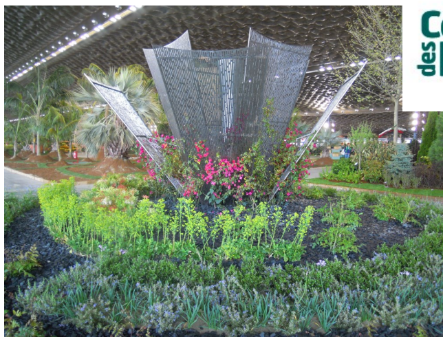
Euroflora - Gênes (Italie)