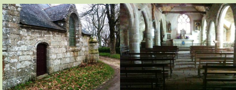
Chapelle de Trémalo, Pont-Aven