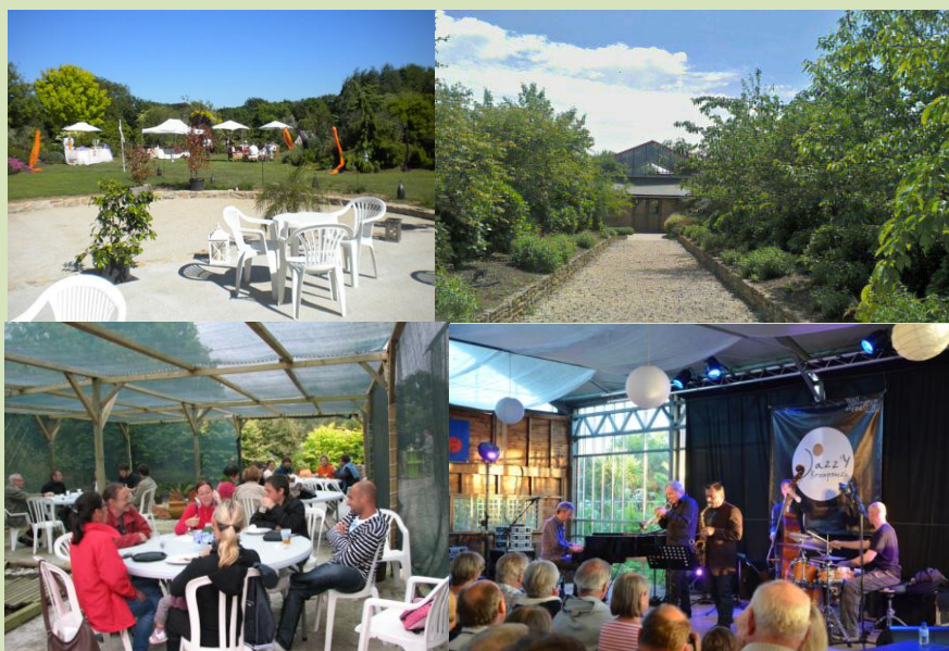
Jardins de Rospico, Névez