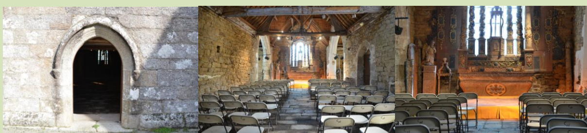
Chapelle Ste Barbe, Névez