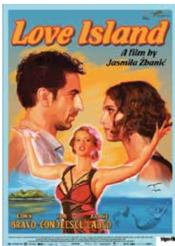
Love Island de Jasmila Zbanic (Bosnie/2014)