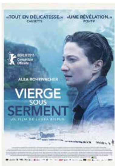
La Vierge sous serment de Laura Bispuri (Albanie/2014)