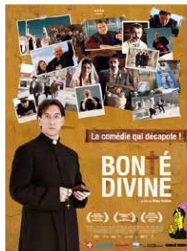
Bonté Divine de Vinko Bresan (Croatie/2014)