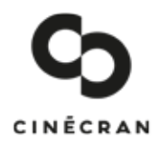
GRAPHISME : Sébastien Le Gourtiérec - TYPOGRAPHIES : Velvetyne Type Foundry

Dossier de presse Association Cinécran - Vannes