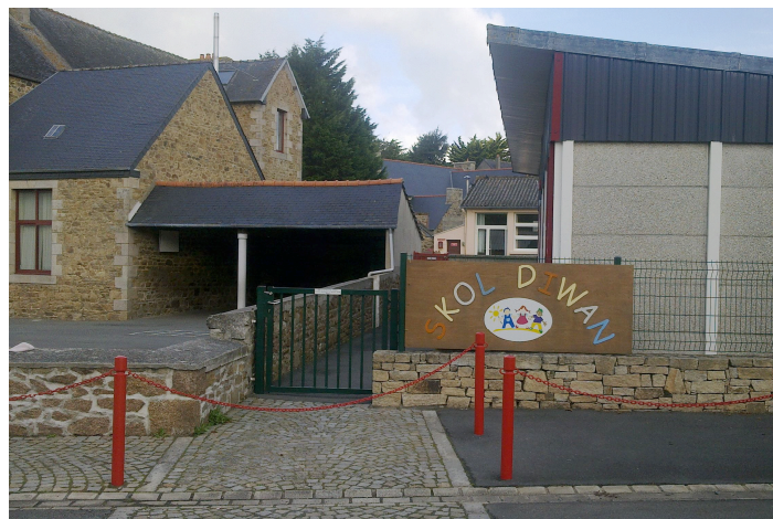
SKOL DIWAN LOUANEG – Faits & documents