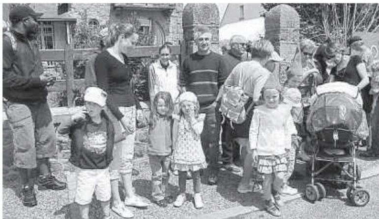
Quatre vingts randonneurs ont marché, en musique, sur les traces de saint Yves.

Dès 14 h, près de 80 randonneurs, parents et jeunes enfants, se sont rassemblés dans le jardin de l'école Diwan, avant d'arpenter six sentiers, précédés de musiciens de bombarde, biniou, accordéon et flûte traversière. La promenade les a menés à Kerizout, à Barac'h, sur les bords du Truzugal et à la pierre de Saint-Yves, derrière l'église. À chacun de ces arrêts, un conteur a retracé, en breton et en français, la vie d'Yves Héloury.