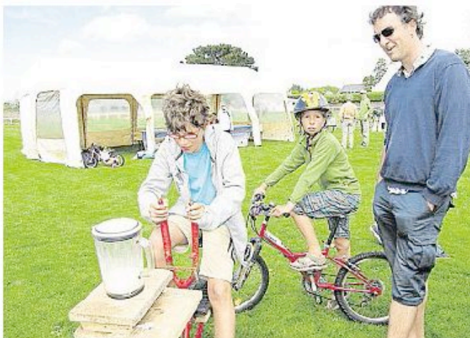
Le vélo, une possibilité de préparer sa boisson écologique grâce au vélomixeur.

Adultes, enfants, voire des très jeunes, étaient réunis sur la pelouse du stade où chacun pouvait exercer ses talents de cycliste, sur des circuits concoctés par les organisateurs sur des machines modernes, mais également d'un autre temps. Une réunion familiale qui a permis de sensibiliser le public sur les biens fondés de l'usage du vélo dans la vie de tous les jours, pas uniquement pour le loisir, mais aussi