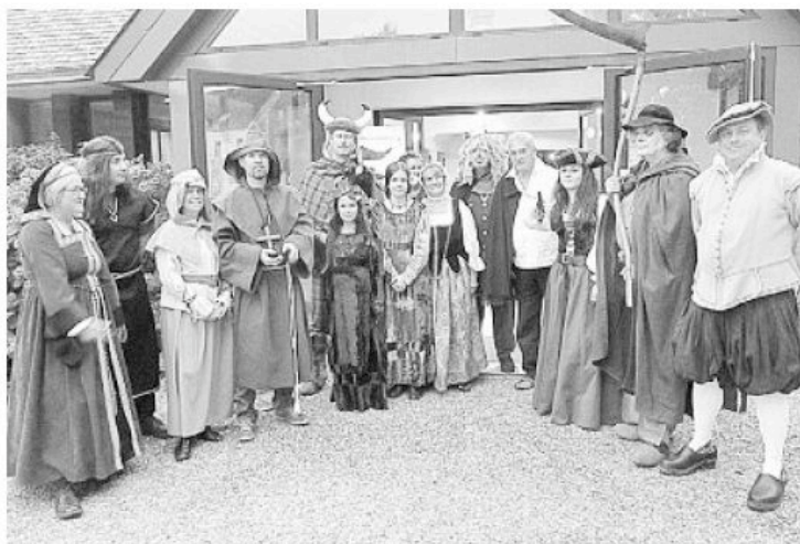
Une belle brochette de personnages historiques entourent l'Ankou et sa faux.

L'Ankou était de retour samedi soir dans la cité de Picou. Ce fut l'occasion de revisiter tous les héros et légendes bretonnes : un événement festif et culturel à la fois. Ils étaient plus de cent, sur les deux cents entrées au fest-noz, à s'être déguisés. Des déguisements se rapportant à