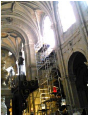
Etanchéité des vitraux en basilique

le plus grand chantier immobilier depuis la construction de la basilique à Sainte-Anne d'Auray