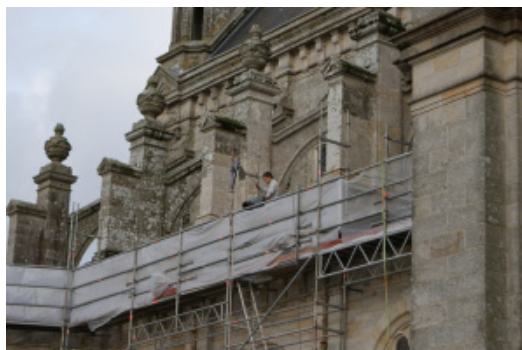
Travail du tailleur de pierre sur les terrasses de la basilique

L'important investissement effectué s'inscrit dans une volonté de la mairie, propriétaire de la basilique, et des acteurs du site de développer l'attractivité de Sainte-Anne d'Auray et de l'inscrire comme grand site en Bretagne. Il abonde également dans la stratégie nationale pour un tourisme français leader mondial.