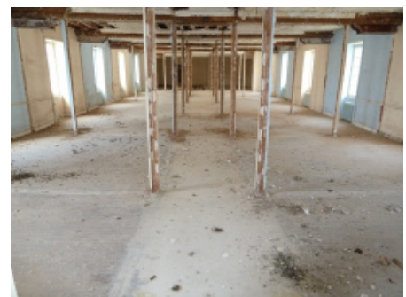
Etat actuel du bâtiment à restaurer de l'Académie