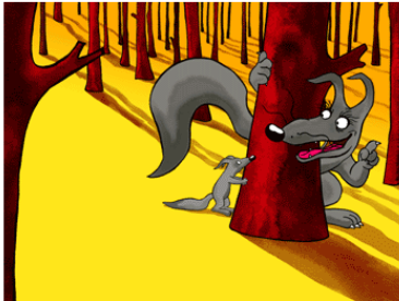
Loulou | © 2003 Prima Linea Productions, France 3 & Gebeka Films

Un abadenn gant Serge Elissalde Séance en présence de Serge Elissalde