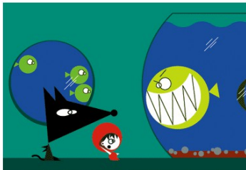
T'es où Mère-Grand?! | © 2003 Prima Linea Productions & Gebeka Films

Temps d'été au pays des lapins. Mais, tandis que Tom se prélassse sur la plage, un drame se joue dans le sous-bois. Loulou, le jeune loup, se retrouve seul au monde. Comment survivre quand on ne sait ni ce qu'on est ni ce qu'on est censé manger ? Adopté puis répudié par des lapins, Loulou va faire son apprentissage entre le confort douillet du terrier et les périls de la forêt.