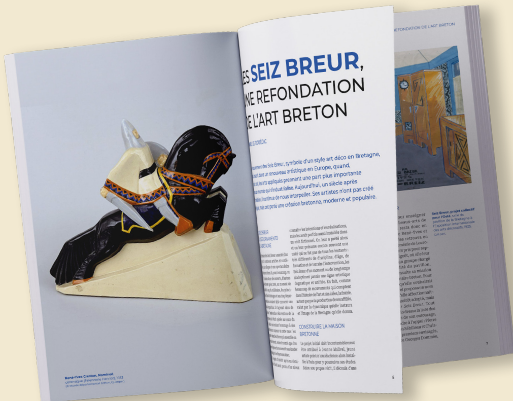
Mook, 19 x 27 cm, 112 pages, broché, impression sur papier offset 120 g.

Avec des regards pluriels, émancipatrice, Istor Breizh s'adresse à tous.