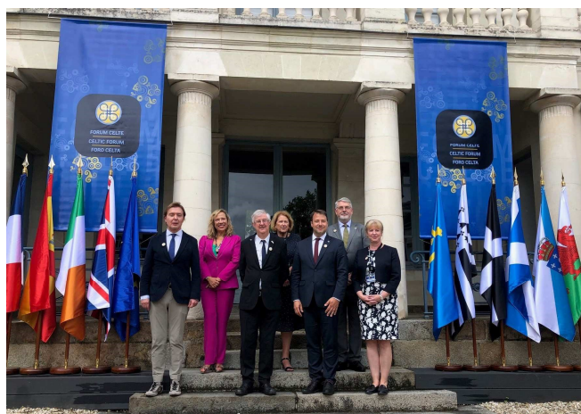
Après la signature de la Déclaration de Rennes