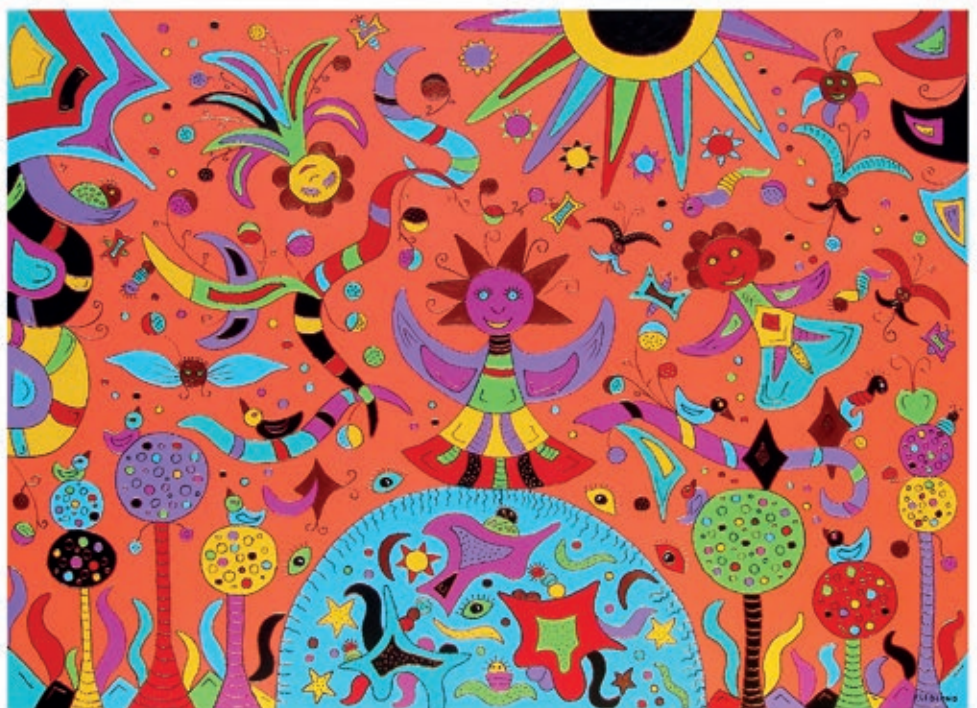
Y'a de la joie