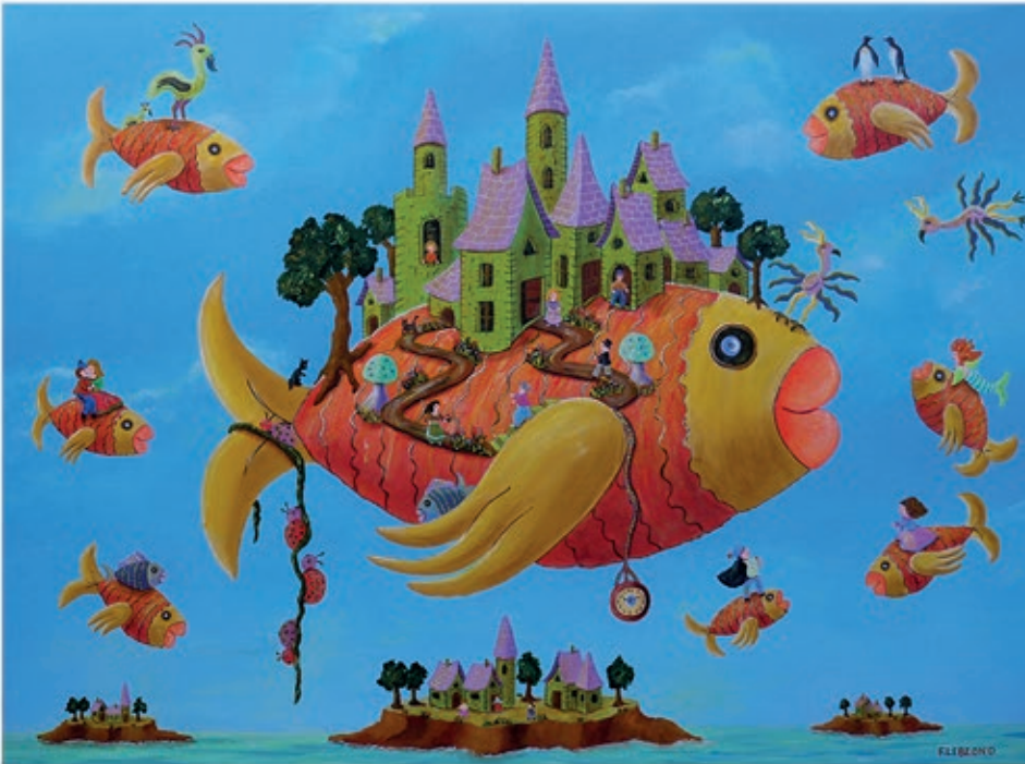
Dix heures dix Acrylique sur toile, 60 cm x 81 cm