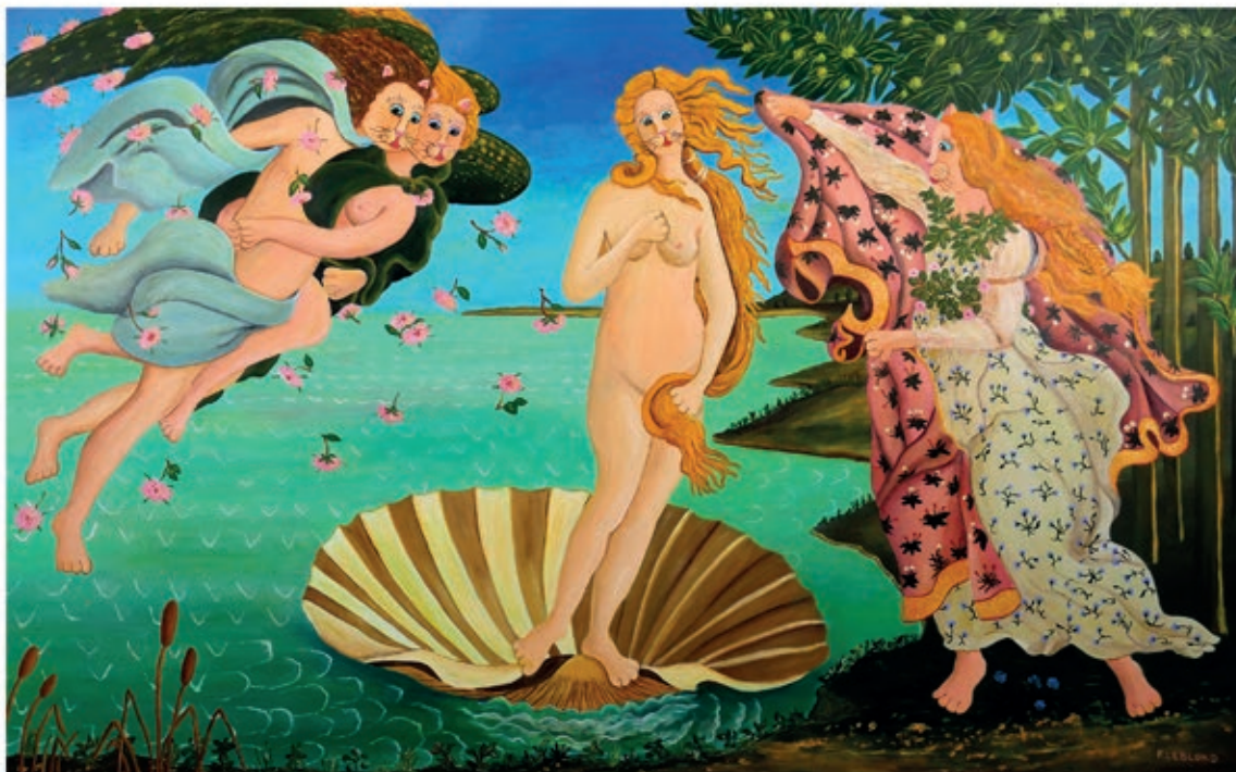
D'après La naissance de Vénus de Sandro Botticelli Acrylique sur toile, 130 cm x 81 cm

Une démarche artistique intéressante dans un monde qui a besoin d'humour et de gaieté.