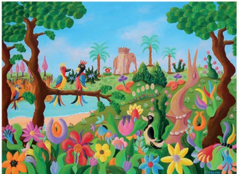
Songe d'une Liberté apaisée Acrylique sur toile, 60 cm x 81 cm

L'idée est que l'imaginaire fait partie de la réalité et que la frontière entre les deux doit être abolie.