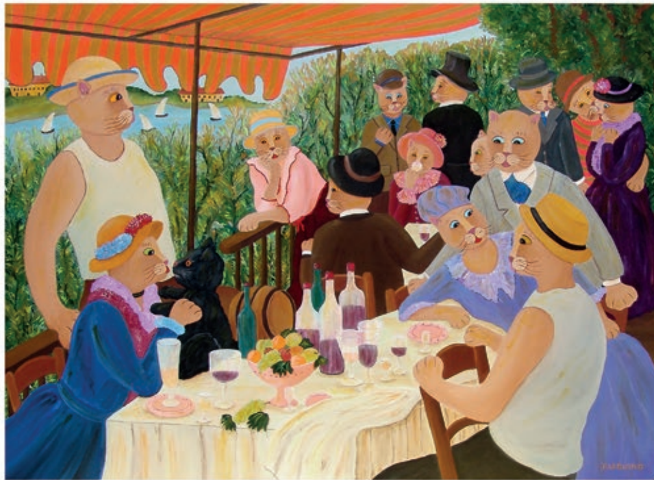
D'après Le Déjeuner des Canotiers d'Auguste Renoir Acrylique sur toile, 73 cm x 100 cm

Discrète par nature, Françoise Leblond se joue des règles de l'art classique comme des interrogations de l'art contemporain mais toujours avec un sens de l'esthétisme.