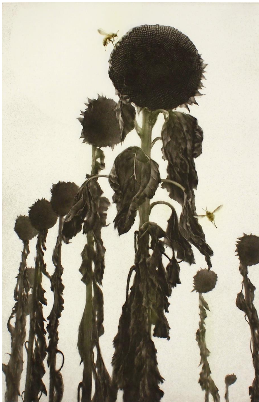
Epilogue solaire 2016 391 x 253 cm.