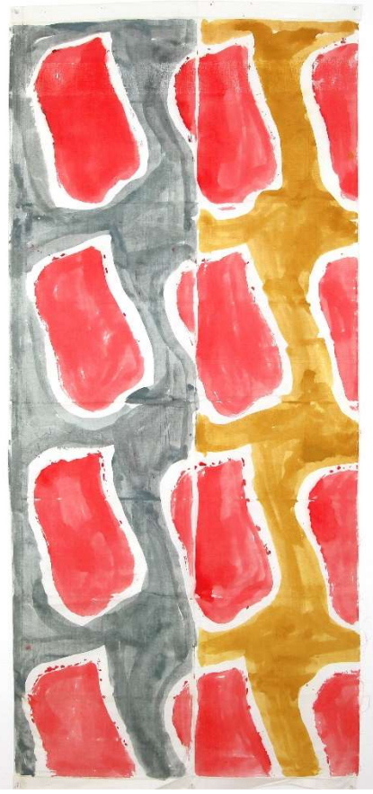
Viallat 2010-279, acrylique sur toile, 2010

L'art de Claude Viallat se caractérise par la somptuosité de la couleur qui l'impose comme l'un des grands coloristes de l'histoire de la peinture occidentale. Il crée un univers vivant et fluide proche du ballet où l'image n'est plus la forme mais la grille qui en résulte. « ... ce qui compte, c'est la manière dont les couleurs jouent avec les couleurs qui sont en dessous, comment d'une manière intuitive et non voulue, non prévue, j'arrive à organiser une surface en densité, en intensité. » (Claude Viallat)