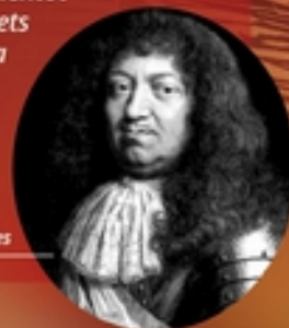
Le Duc De Chaulnes

Une troupe de comédiens ambulants raconte, de bourg en bourg, les révoltes qui secouèrent la région de Bordeaux, en mars 1675 ; puis Rennes, Nantes, Guingamp en avril et mai ; avant d'embraser au son du tocsin, Briec, Châteaulin, Quimper, le Pays Bigouden, Saint-Hernin, Carhaix et tout le Centre-Bretagne, au cours du printemps des Bonnets Rouges. Tandis que le roi Louis XIV, entre la guerre qu'il mène à la Hollande et les nouvelles alarmantes de la Bretagne, s'amuse à Paris, aux comédies de Molière et aux ballets de Lully. Mais bientôt c'est le glas de l'Automne des Bonnets Rouges qui résonne dans toute la Bretagne : le Duc De Chaulnes secondé par le père Maunoir, entreprend son Tro-Breizh pour réprimer la révolte.