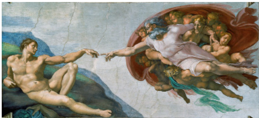
La Création d'Adam, vers 1511