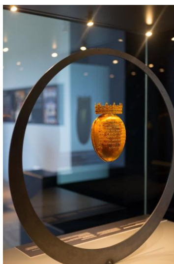
Exposition " Voyage dans les collections " au Musée Dobrée