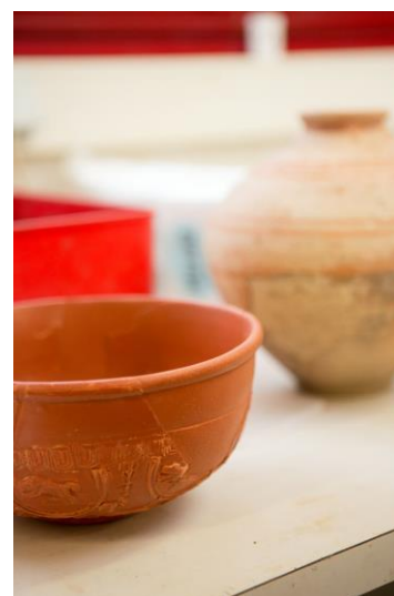
Poteries au laboratoire Arc'Antique