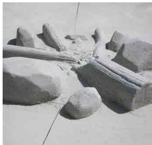
Œuvre de l'artiste Briac Leprêtre Collège de Pont-Château

Découverte de l'œuvre et rencontre avec l'artiste Briac Leprêtre, uniquement le samedi de 16h à 17h30.