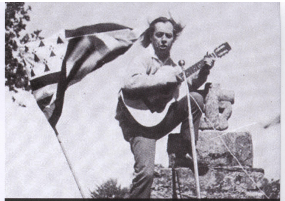
Glenmor sur le site de la bataille à Ballon (Nominoë - 845) à Bains-sur-Oust