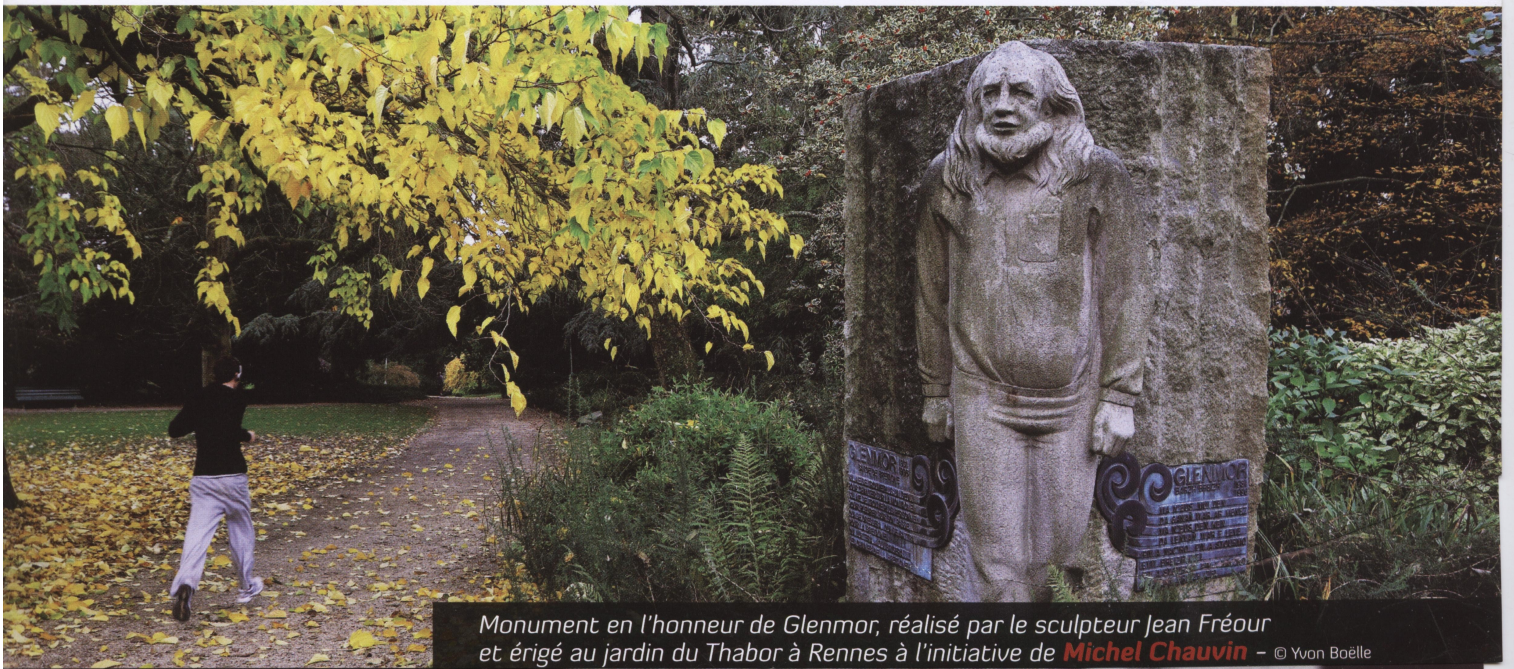
Monument en l'honneur de Glenmor, réalisé par le sculpteur Jean Fréour et érigé au jardin du Thabor à Rennes à l'initiative de Michel Chauvin