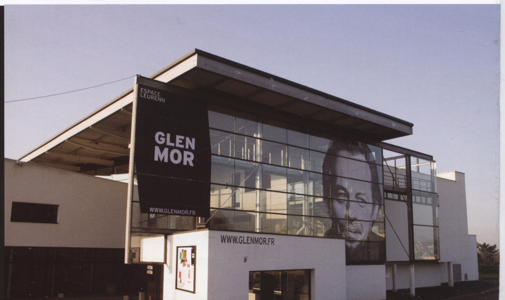
L'Espace/Leurenn Glenmor de Carhaix a fêté ses dix ans en 2011

Pour les 10 ans de l'Espace/ Leurenn Glenmor à CARHAIX, une heureuse coproduction entre la ville de CARHAIX et l'association de Production et Diffusion DIHUNERIEN a permis la création du spectacle GLENMOR l'Insoumis/ Disuj.