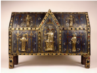
Châsse de saint Calminius, XIII e siècle

Par Claire Bardoul, guide conférencière au musée Dobrée