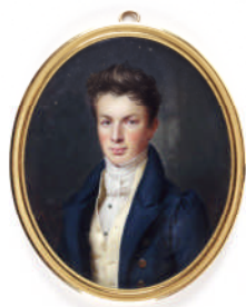
Portrait de Thomas II Dobrée, 1829