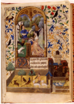
Livre d'heures : Horae Virginis, preces piae , seconde moitié du XV e siècle