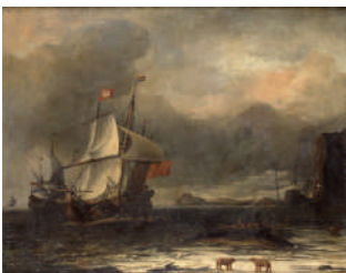
Paysage polaire par Aernout Smit, seconde moitié du XVII e siècle