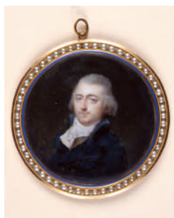
Portrait de Pierre-Frédéric Dobrée, 1778

Cette 1 ère partie présente l'arrivée de Pierre-Frédéric dans la ville de Nantes à la fin du XVIII e siècle, au cœur d'une élite négociante et d'une communauté protestante importante. C'est le point d'ancrage de la famille Dobrée à Nantes.