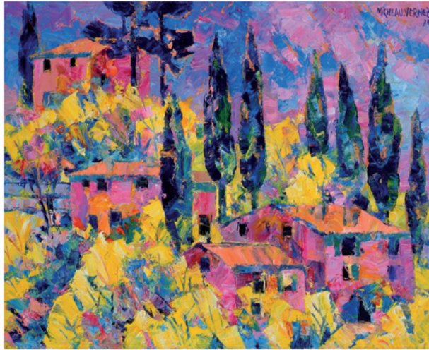
Cypres et mimosas en Provence, 1978, Huile sur toile