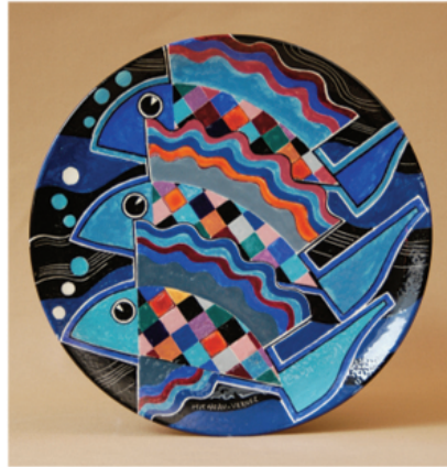
Plat aux poissons, 1960, faïence.

Micheau-Vernez est connu en Bretagne pour ses faïences réalisées par la manufacture Henriot à Quimper. De 1930 à 1960, il crée en effet quelques 140 sculptures qui seront éditées en faïence. L'artiste apporte une décoration ethnographique à ses personnages habillés en costume breton. Il sera le premier sculpteur à donner à ses faïences du mouvement et de la vie, dans une facture très moderne pour l'époque. Cette célébrité méritée masquera cependant son œuvre pictural.