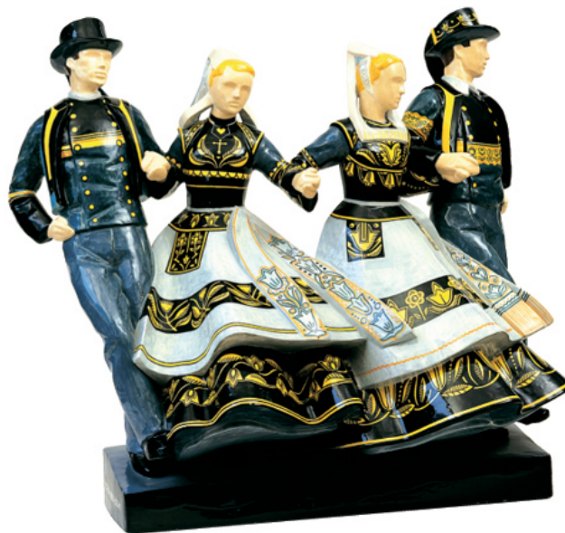
Gavotte de Quimper, 1948, faïence.

Micheau-Vernez est connu en Bretagne pour ses faïences réalisées par la manufacture Henriot à Quimper. De 1930 à 1960, il crée en effet quelques 140 sculptures qui seront éditées en faïence. L'artiste apporte une décoration ethnographique à ses personnages habillés en costume breton. Il sera le premier sculpteur à donner à ses faïences du mouvement et de la vie, dans une facture très moderne pour l'époque. Cette célébrité méritée masquera cependant son œuvre pictural.