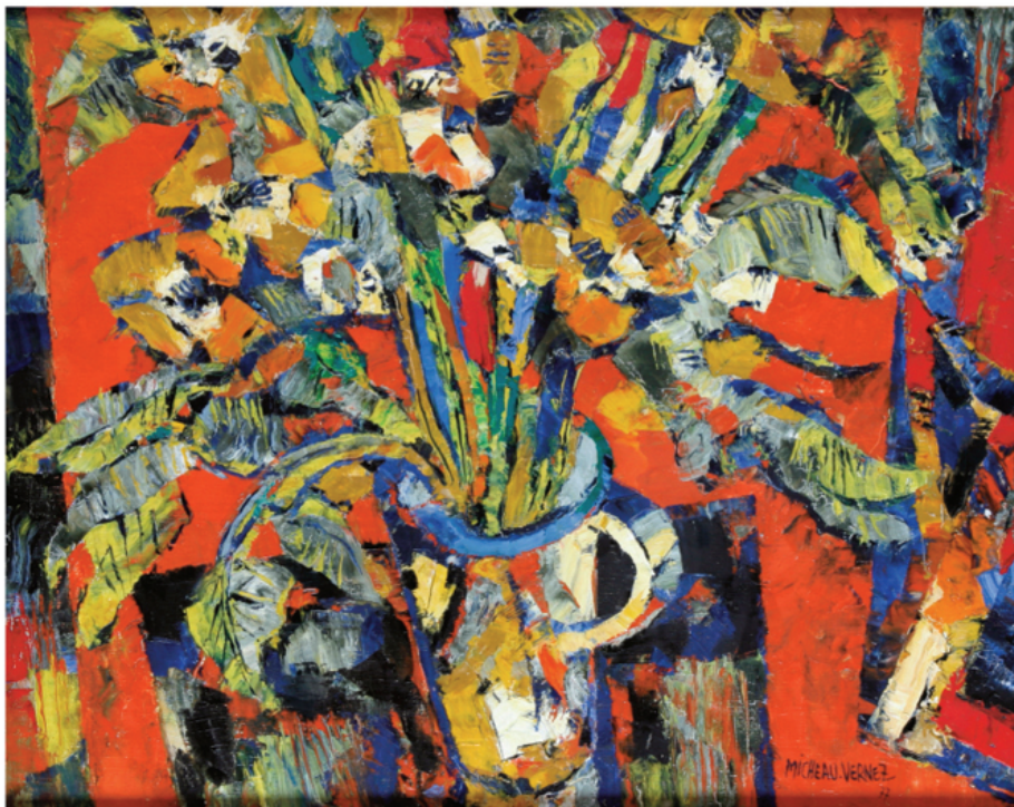
Fleurs au fond rouge, 1976, huile sur toile.