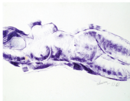
Nu, 1968, pastel.

En alternance à la peinture, il pratique régulièrement le dessin, pour garder la main, en conservant une technique très sûre. Celle-ci s'exprime jusque dans des nus d'une grande pureté, traitée également d'une manière très personnelle où il transcende la beauté de la femme.