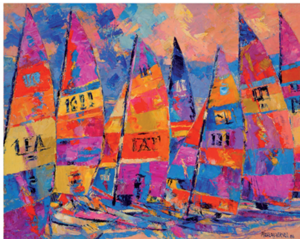
Catamarans, 1986, huile sur toile.