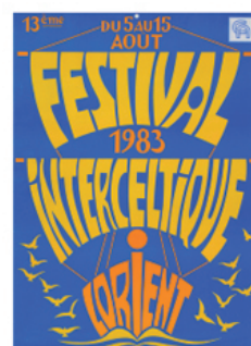
Festival Interceltique, 1983.

Autre technique qui doit accrocher l'œil, être lisible et efficace, tant en ce qui concerne le graphisme que le visuel les affiches de Micheau-Vernez se démarquent toujours par leurs qualités artistiques.