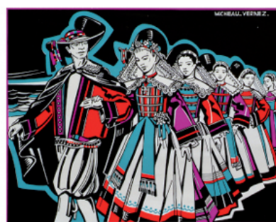
Mariage de paludiers, 1970.

La qualité technique de ses illustrations, la vivacité des traits, l'originalité de ses compositions et son imagination fertile feront le bonheur de quelques éditeurs.