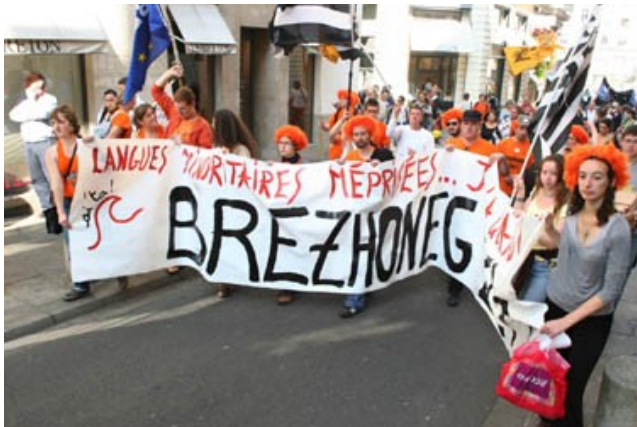
Collectif AITTA : du breton à la SNCF Manifestation de Nantes septembre 2008

Behatokia, l'Observatoire des droits linguistique des bascophones, dans un rapport déposé en mai 2007 au comité des droits économiques, sociaux et