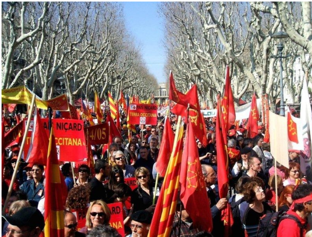
Manifestation de Béziers le 17 mars 2007 20 000 personnes