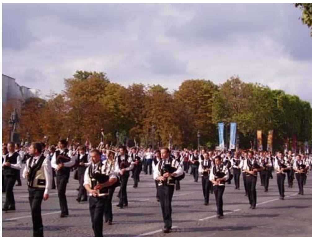
Breizh Touch Parade sur les Champs Élysées (23 septembre 2007)