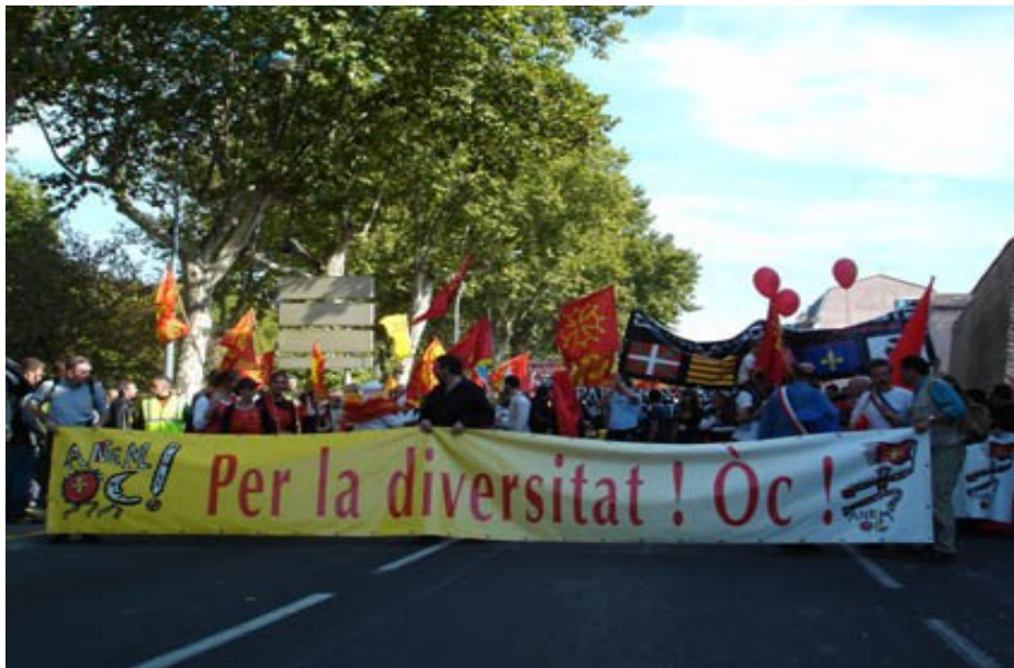
10 000 manifestants pour la langue occitane à Carcassonne le 22 octobre 2005 (ci-dessus). Ils étaient 20 000 à Béziers le 17 mars 2007.

Atteinte à la liberté d'expression et d'information (article 11 de la Charte des droits fondamentaux et article 10 de la Convention européenne des droits de l'homme), dans la mesure où la loi et les décisions qui sont prises par les autorités publiques n'autorisent pas les locuteurs de langues régionales à disposer des médias audiovisuels pour créer et diffuser librement dans leurs langues propres et exprimer leur créativité et leur propre personnalité, devant se contenter de subir, pour l'essentiel, la pensée des médias audiovisuels centralisés. On notera à ce sujet les positions du groupe d'experts de l'OSCE "guidelines on the use of Minority Languages in the Broadcast media" (octobre 2003) qui déclare que "la liberté d'expression de chaque personne, y compris celles qui appartiennent à des minorités nationales, comprend le droit de recevoir, de chercher et de transmettre des informations et des idées dans la langue et le média de son choix.»