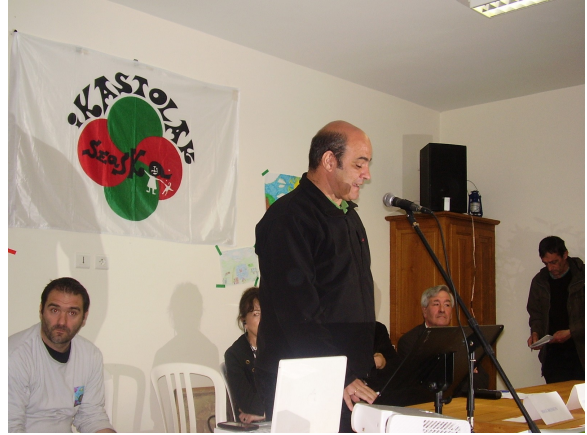
Conférences pour les 40 ans de Seaska mai 2009

Mais si certaines avancées ont pu être obtenues, on le doit d'abord à la volonté des citoyens qui, face aux refus, faux-semblants et à la mort programmée de leurs langues par l'Etat français, ont décidé de créer eux-mêmes leurs propres écoles à caractère public. Sans moyens, mais avec le seul soutien financier populaire et militant d'abord, il s'agissait pour eux d'un véritable défi. En 1969, les Basques de Seaska ont créé leur première Ikastola, puis en s'inspirant de cette initiative, les écoles bretonnes Diwan, les écoles Bressola et Arrels en Catalogne,