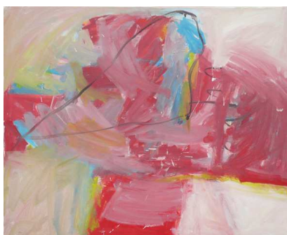
Orphéens aux enfers