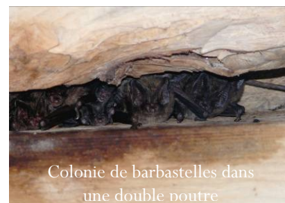
Colonie de barbastelles dans une double noure

Le GMB a conçu un outil pour tenter d'agir sur cette deuxième cause de déclin des chiroptères :