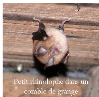
Petit rhinolophe dans un comble de grange

Les chauves-souris sont dépourvues de tout comportement constructeur et ne détériorent pas les constructions. C'est donc d'abord pour expliquer que la cohabitation avec ces animaux menacés n'est qu'à de rares exceptions près une source de désagrément pour nous, que l'association propose cet engagement aux propriétaires.