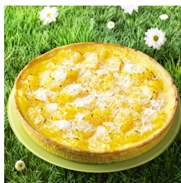
Tartelette Ananas Coco