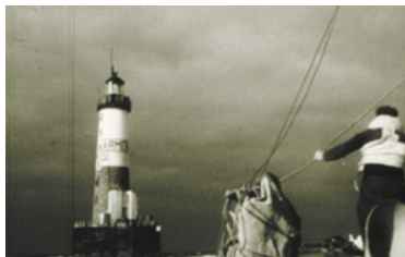
La relève d'Ar Men 1