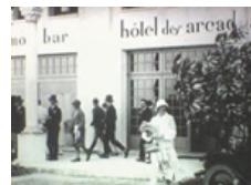
Sables d'Or Les Pins - 1923/1925 - 35 mm - 20 min.