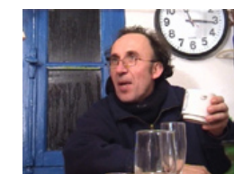
20 ans à Molène...

L'immigration sur les îles, c'est aussi l'histoire d'étrangers venus chercher du travail en France. Moradores , de Jeanne Dressen (2007, 52 min) raconte cette histoire en suivant les pas de Portugais qui, fuyant le régime de Salazar, se sont retrouvés par hasard sur l'île de Groix pour construire un barrage, et pour finalement y faire leur vie.