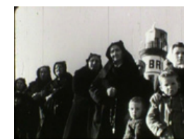
La Mer et les Jours

La Cinémathèque profitera de cette soirée spéciale pour présenter des films d'archives amateurs qu'elle conserve, et tournés sur l'île de Sein dans les années 50. Finis Terrée avec ceux de Sein (1957), Ar Groac'h (1958) de Roger Dufour qui retracent la dure vie des gardiens de phares du raz de Sein, ou Île de Sein, 20 juillet 1952 d'Etienne Legrand qui évoque la vie religieuse des Sénans après-guerre. Des documents qui, rassemblés, représentent tous autant un témoignage marquant sur les usages de la vie insulaire.