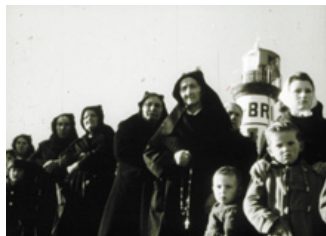
Le Men Brial