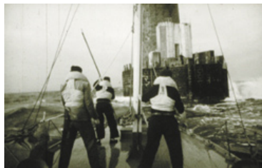
La relève d'Ar Men 2