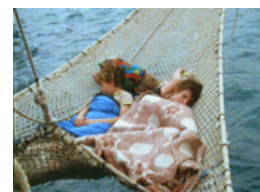
Les Enfants Dauphins

Le deuxième film se révèle plus militant et met le spectateur face aux témoignages et à la colère d'enfants de Guérande et de l'île de Groix, qui voient leur espace de vie et leur aire de jeu souillés par la marée noire de l'Erika, en 2000 : désarroi face à la catastrophe, mais aussi obstination pour que cela ne se reproduise plus jamais.