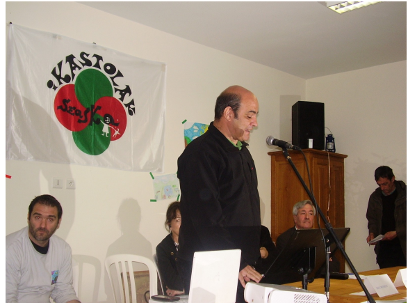
Conférences pour les 40 ans de Seaska mai 2009

Mais si certaines avancées ont pu être obtenues, on le doit d'abord à la volonté des citoyens qui, face aux refus, faux-semblants et à la mort programmée de leurs langues par l'Etat français, ont décidé de créer eux-mêmes leurs propres écoles à caractère public. Sans moyens, mais avec le seul soutien financier populaire et militant d'abord, il s'agissait pour eux d'un véritable défi. En 1969, les Basques de Seaska ont créé leur première Ikastola, puis en s'inspirant de cette initiative, les écoles bretonnes Diwan, les écoles Bressola et Arrels en Catalogne, Calandreta en Occitanie et ABCM en Alsace, ont vu le jour les unes après les autres. Et aujourd'hui les écoles de Seaska et de Diwan conduisent leurs élèves de l'école maternelle au baccalauréat en assurant un véritable plurilinguisme fondé sur l'usage premier de la langue dite « régionale », avec d'excellents résultats reconnus par tous et en particulier par l'Education nationale.