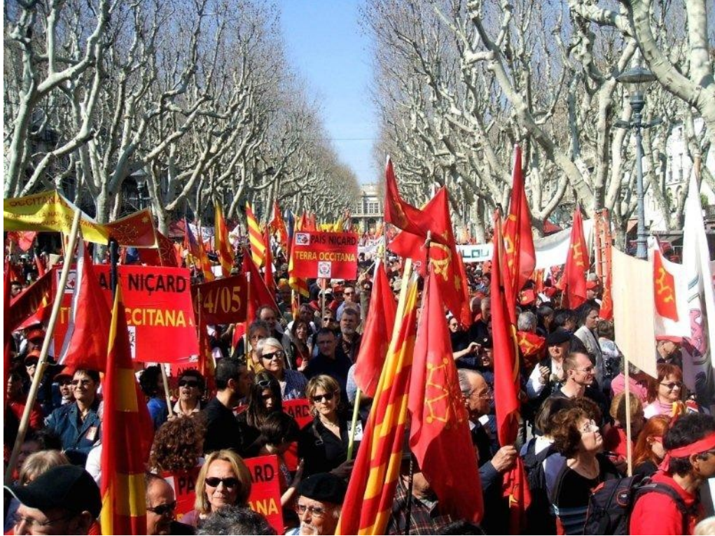
Manifestation de Béziers le 17 mars 2007 20 000 personnes