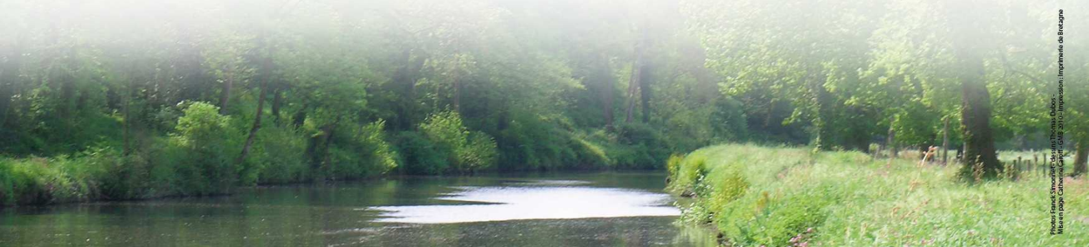
Mise en page Catherine Carré - GMB 2010 - Impression Imprimerie de Bretagne

Programme et suivi des aventures au jour le jour : www.gmb.asso.fr