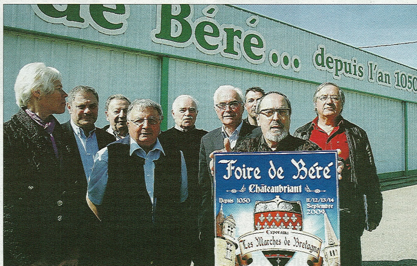
Le comité d'organisation promet encore une remarquable Foire de Béré.

Animation 960 e Foire de Béré les 11, 12, 13 et 14 septembre Sous le signe du Moyen Âge