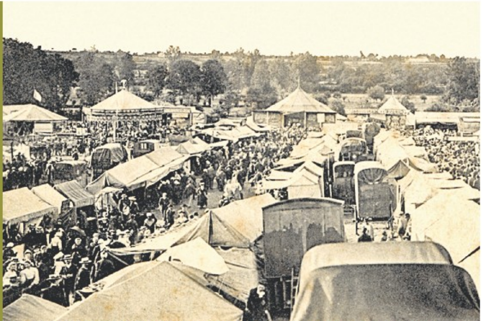
"Début septembre constitue, dans le temps, une excellente date pour l'agriculture car la foire se déroulait après la moisson et avant les travaux d'automne" expliquent les organisateurs. "Les paysans avaient un peu de temps et d'argent"