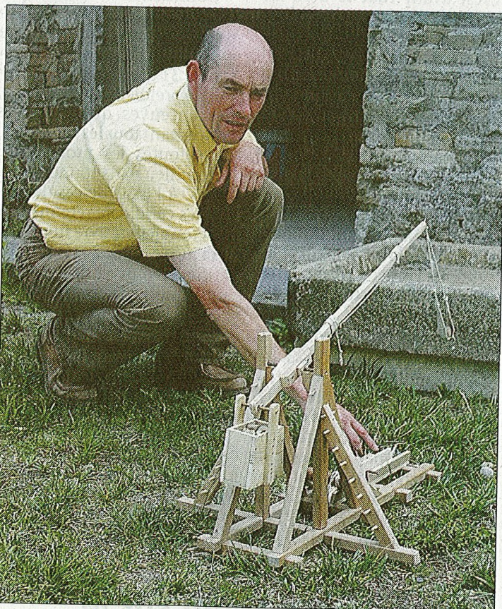
Et en plus, elles fonctionnent !

Pratique : si vous êtes intéressés par Fol Epervier ou si vous êtes en possession de vestiges du Moyen Age, contactez Fol Epervier au 02 40 07 60 90.