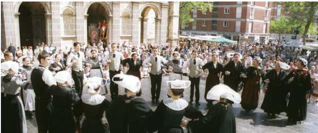
Le cercle de Guingamp, quartier Saint-François

Entourée de nombreux bénévoles et soutenue par la ville, l'association organise les 23 et 24 mai au cœur du quartier Saint-François, deux jours de fête avec défilé des six bagadoù présents au Havre, deux grandes scènes ouvertes, un fest noz sous chapiteau et un grand marché réunissant tous les produits du terroir celtique (bières, cidres, crêpes, galettes, vêtements, artisanat...).