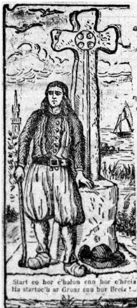
La fameuse vignette de la manchette du Courrier du Finistère .

Le portrait dressé par Paul Meunier, au-delà du pittoresque du personnage, nous donne à voir un homme, acteur plus que témoin, confronté aux bouleversements de son siècle, nous rappelant un temps, pas si lointain, où Monsieur le recteur régnait sans partage sur sa paroisse.