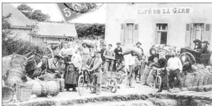
Voyageurs et pommes de terre primeurs à l'embarquement en gare de Penvénan