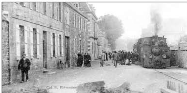
Arrêt de Pont-Couënnec - Perros-Guirec

Bien au-delà de l'histoire du chemin de fer départemental, l'auteur retrace un siècle d'histoire trégorroise, riche en anecdotes savoureuses et en profonds bouleversements. Cet ouvrage rappelle enfin que, en quelques décennies d'existence, le Petit Train a largement contribué au développement économique et à la notoriété nationale du Trégor.