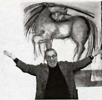
L'Enfant-Phare, livre d'artiste de Claude Nougaro - Gaïde - Atelier Tugdual