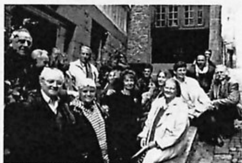
Devant la Maison des Poètes de St-Malo