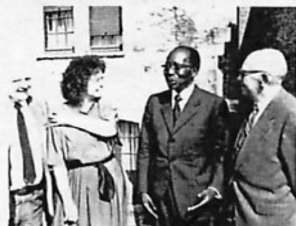
Avec Léopold Sedar Senghor