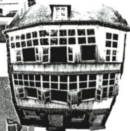
Maison des Poètes