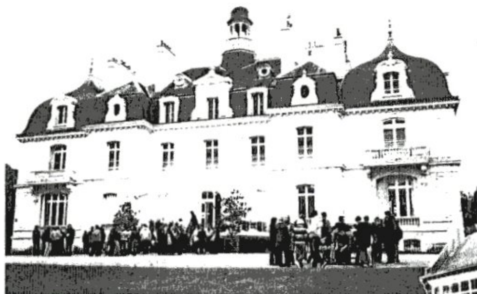
Château de La Briantais, St-Malo