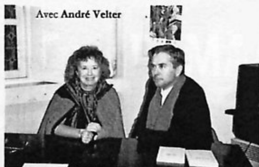
Avec André Velter