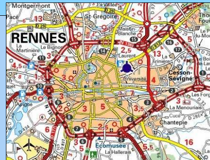
Ferme des Gallets

Voyage organisé par Bertaèyn Galeizz , défense et promotion du gallo, en collaboration avec Dastum Breizh, Dihun Breizh, Ecomusée du Pays de Montfort, La Bouèze, La Ferme d'Antan, La Granjagoul, Plum'FM, Stumdi, UBAPAR, DPLO